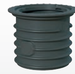
PE-Schachtverlängerung VS 60