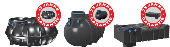
Flachtank NEO Erdtank BlueLine II Flachtank F-LINE

Wählen Sie Ihren Speicher aus drei Tank-Varianten: Die Tankfarbe kann bei Lieferung abweichen!