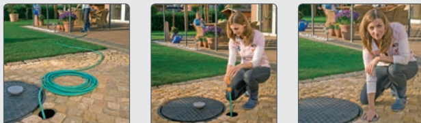
Bis zu 20 m Schlauch ausziehen, gießen, bequem aufrollen lassen. Fertig!